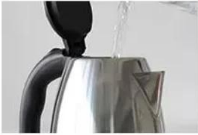
The large capacity of 2.0L