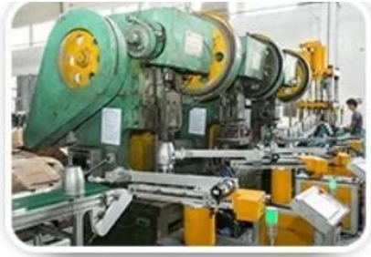
Hardware Stretching and tinseling