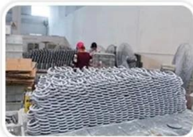
Semi-Finished Heating Tube