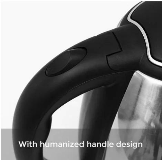
With humanized handle design