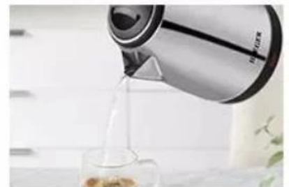
Precise pouring control