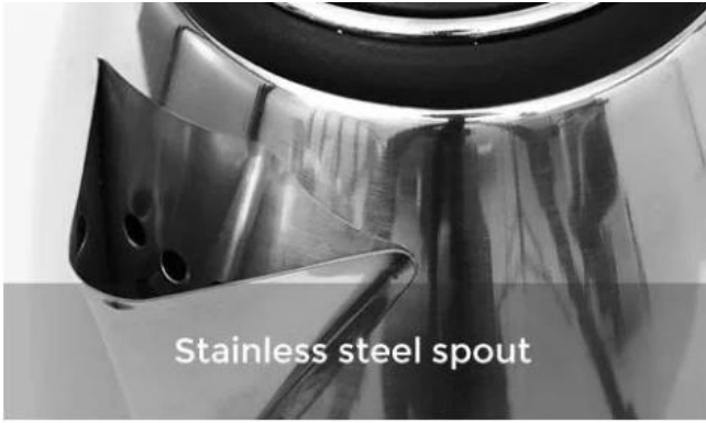
Stainless steel spout