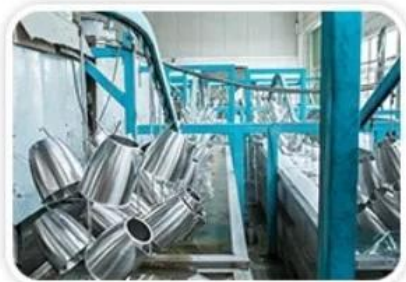
Ultrasonic Wave Cleaning