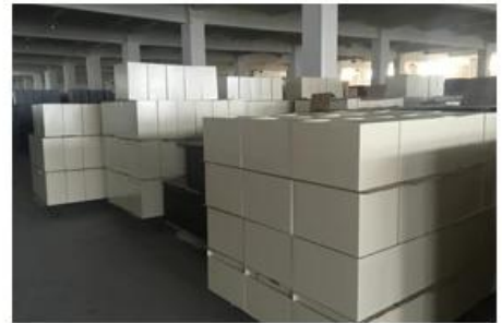
Product sample room