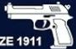
FULL SIZE 1911