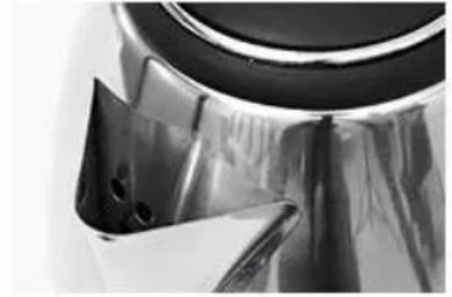
stainless steel spout