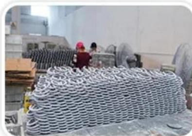
Semi-Finished Heating Tube