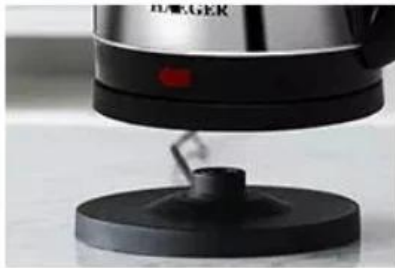
360 degree rotational base