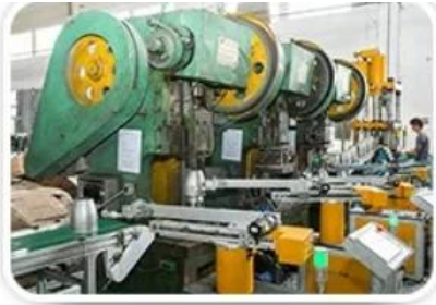
Hardware Stretching and tinseling