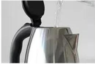
The large capacity of 2.0L