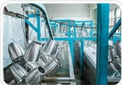
Ultrasonic Wave Cleaning