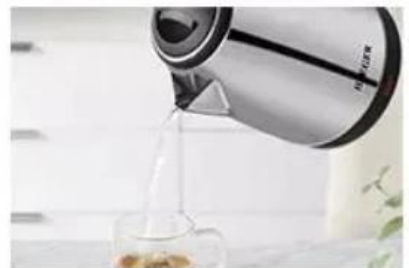
Precise pouring control