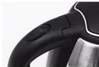
One key control