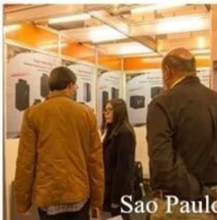
Sao Paulo Security Exhibition 2015