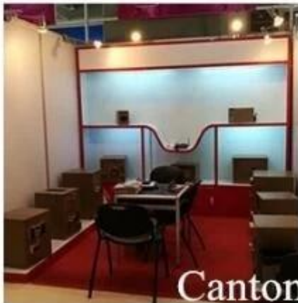
Canton Fair 2016