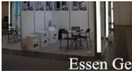
Essen Germany 2016