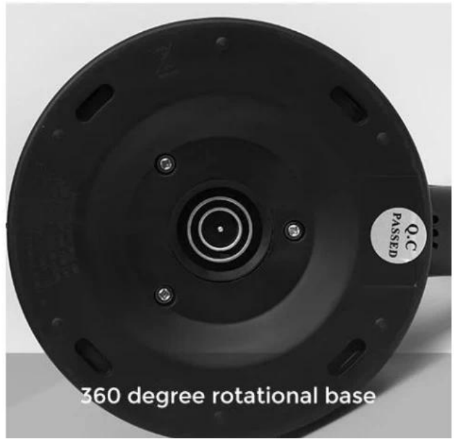
360 degree rotational base