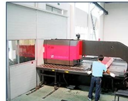
VT300 Punch Machine