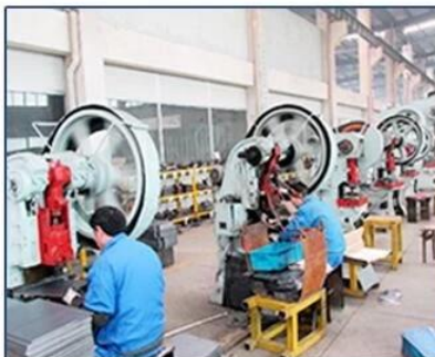
Rope Pull Force