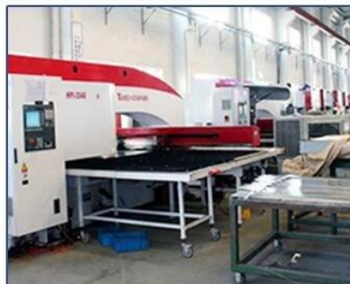
CNC Punching Machine