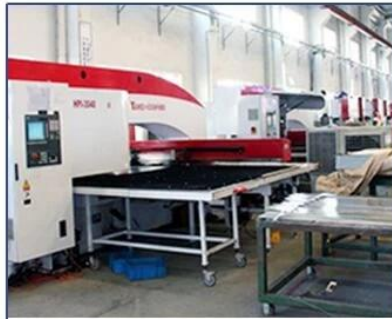
CNC Punching Machine