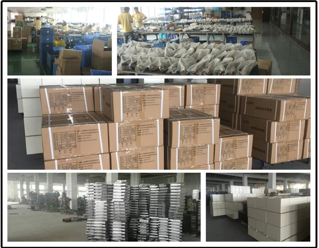
Product sample room